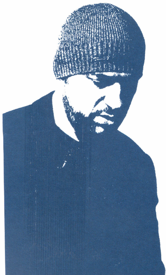
Jan Koum, el fundador de WhatsApp