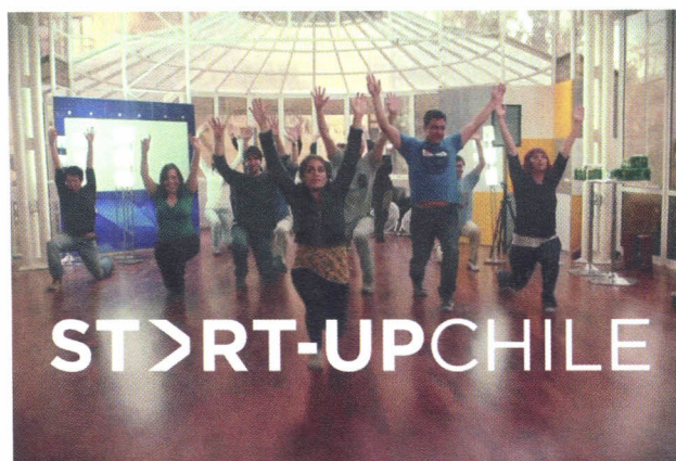
Motores del cambio