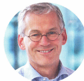
Frans van Houten